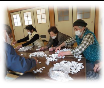
「これはこっちかねえ～」 折鶴を大きさ別に分けていま