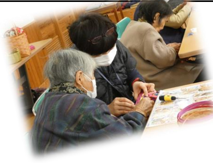
「ここはどうやってするの？」 ～かごづくり～