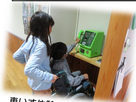
車いす体験 (小学校にて)