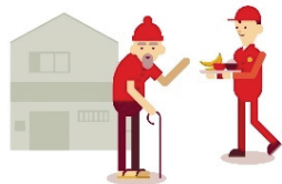
高齢者への配食サービス